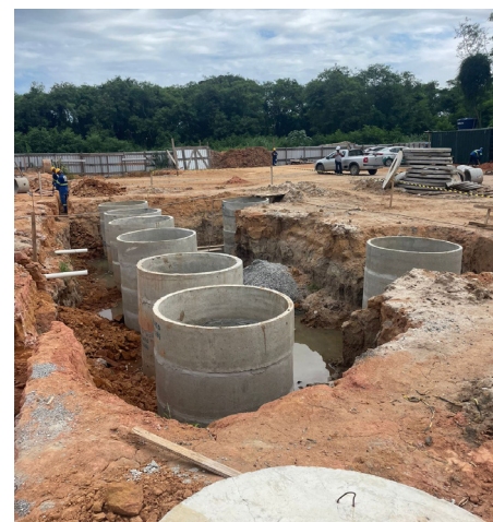
UBS será entregue ainda no ano de 2024

Após o término da construção, a Secretaria Municipal de Saúde fará o aparelhamento da unidade, com a colocação de móveis e demais equipamentos necessários para o funcionamento do local.