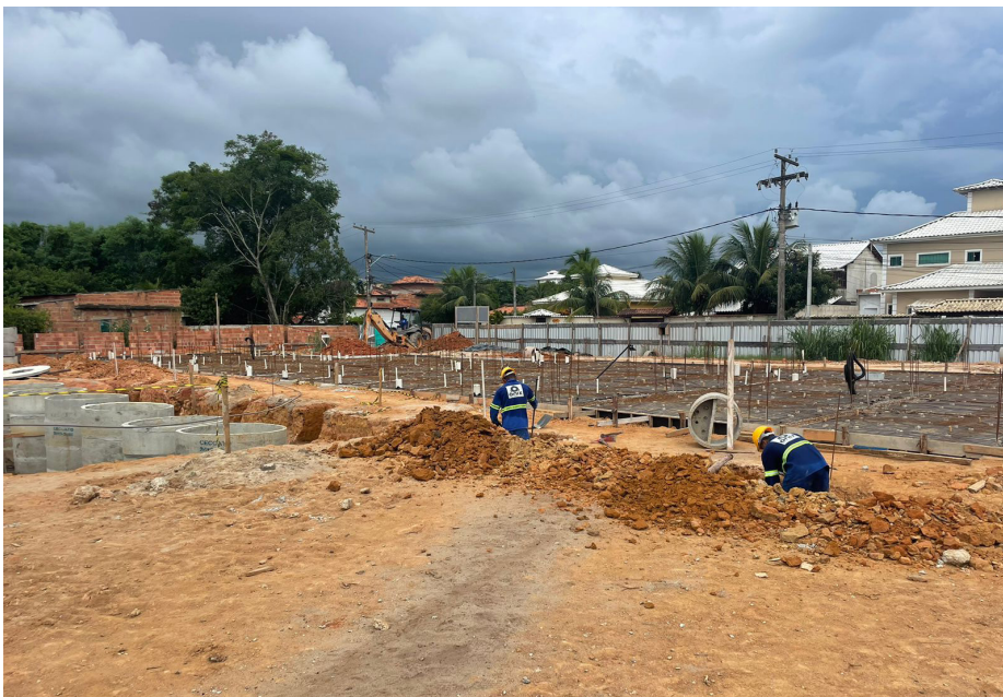
Nova UBS do Verde Vale oferecerá serviços de saúde gratuitos à população

Os investimentos na saúde pública de Saquarema não param! A Prefeitura, por meio da Secretaria Municipal de Obras Públicas, segue com a construção da nova UBS do bairro Verde Vale. A nova Unidade Básica de Saúde, que está sendo erguida na Avenida Ademar Aurelino Barreto, atenderá aos moradores do bairro e redondezas.