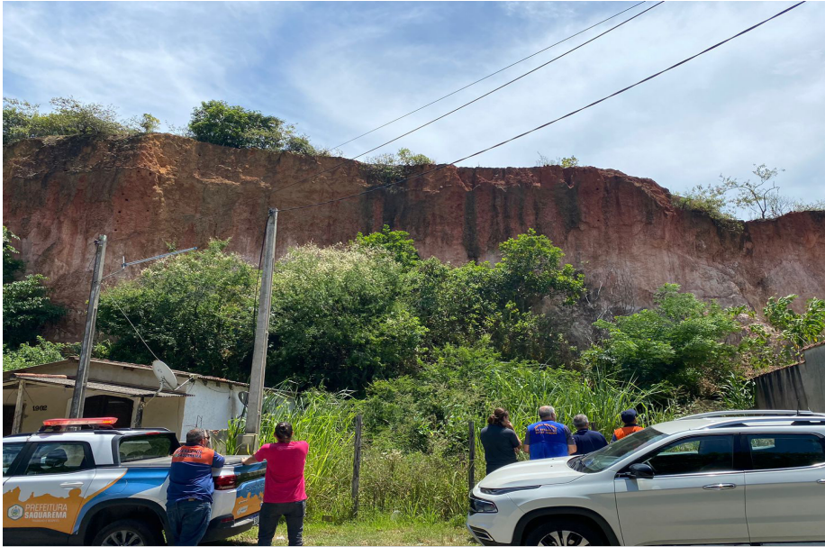
Equipes vistoriaram áreas de encostas em diversos pontos da cidade

A Secretaria Municipal de Segurança e Ordem Pública – SMSOP de Saquarema, por meio da Coordenadoria Municipal de Proteção e Defesa Civil de Saquarema – COMPDEC, recebeu uma visita operacional da Defesa Civil Estadual.