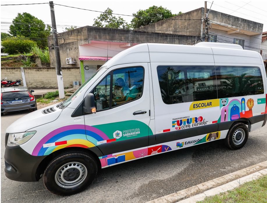
Novas vans serão utilizadas no transporte de alunos das creches municipais

A Prefeitura de Saquarema, por meio da Secretaria Municipal de Educação, Cultura, Inclusão, Ciência e Tecnologia, disponibilizou 40 novas vans da marca Mercedes-Benz para o transporte dos alunos das creches municipais. Denominado “Transportando o Futuro com Carinho”, a ação vem para complementar o serviço de transporte de estudantes em ônibus escolares, que já vem sendo destinado, pelo município, aos estudantes com mais de 7 anos.