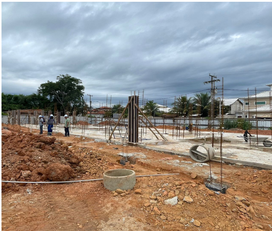
Nova UBS do bairro Verde Vale ampliará a rede de saúde básica na cidade

Terá novos equipamentos para atendimento ao paciente, mais conforto e novas especialidades médicas, além de atendimento odontológico, coletas para exames laboratoriais, vacinas e acompanhamentos para diabéticos, hipertensos, gestan-