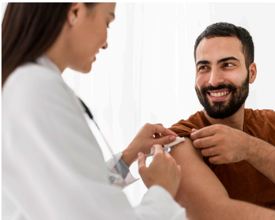
Campanha de vacinação contra a gripe acontece em todos os postos de saúde

É importante alertar à população que NÃO serão vacinadas as pessoas fora destes