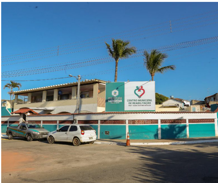
Centro Municipal de Reabilitação já realizou mais de 153 mil atendimentos

O Centro Municipal de Reabilitação Professora Dilma Coutinho da Silva completou 5 anos de existência. Vinculado à Secretaria Municipal de Saúde, o Centro é referência para a rede de atenção à saúde da pessoa com deficiência em Saquarema.