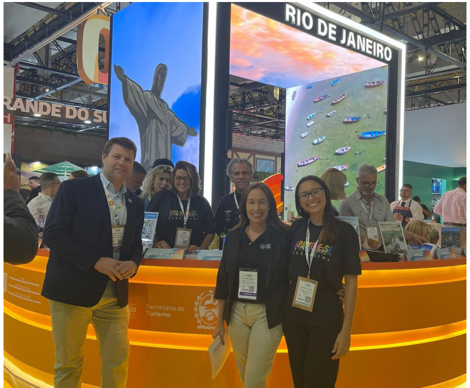
Representantes de Saquarema com o Secretário de Estado de Turismo, Gustavo Tutuca

Com 27 mil profissionais e 620 empresas expositoras reunidos em São Paulo, a WTM é o ponto de encontro crucial para a indústria de viagens, onde negociações e acordos são selados, contribuindo para posicionar nossa região como uma das mais importantes do mundo.