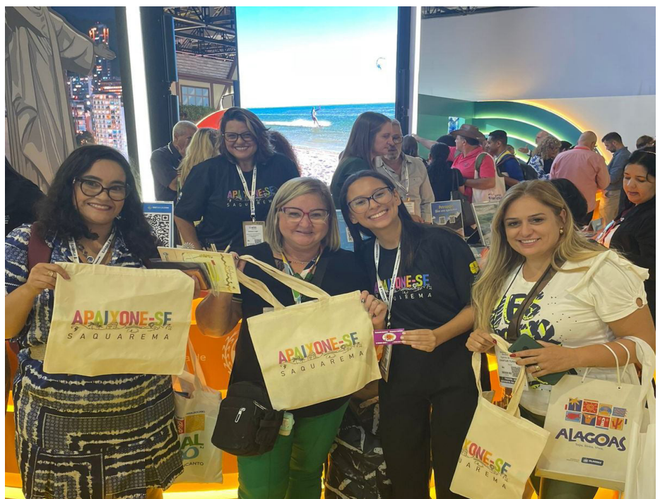
Saquarema foi um dos destinos mais procurados no stand do Estado do Rio