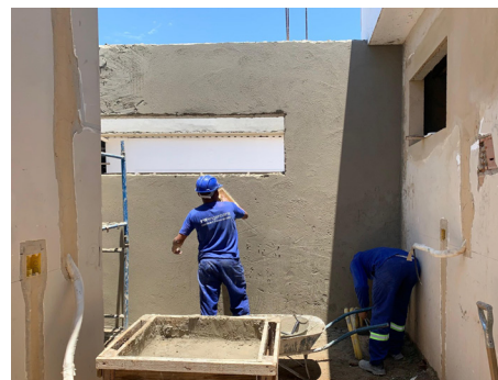
Obra segue em ritmo acelerado.

promoção da cultura e outros serviços necessários para garantir a funcionalidade do espaço.