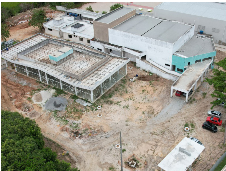
A obra contempla a modernização da biblioteca e a inclusão de recursos tecnológicos.

Com o convênio com o Estado cancelado, foi necessário revisar o planejamento inicial para atender às novas demandas da Secretaria Municipal de Educação. Entre as adequações já em