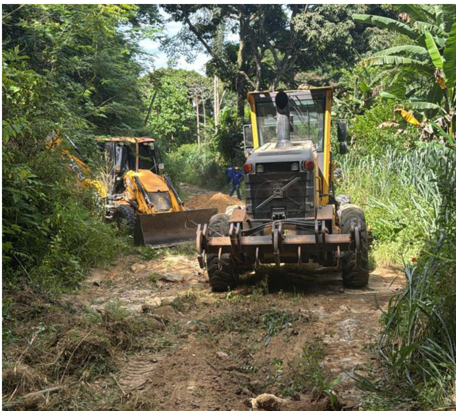
Serviços buscam melhorar as condições das estradas e vias rurais do Município

A Prefeitura de Saquarema, por meio da Secretaria Municipal de Transporte e Serviços Públicos, segue com os trabalhos de manutenção das estradas rurais da cidade. As vias são importantes para a mobilidade de moradores dos bairros mais afastados do Centro da cidade, além de atuarem como acesso às propriedades rurais e promovem o escoamento da produção agrícola do Município.