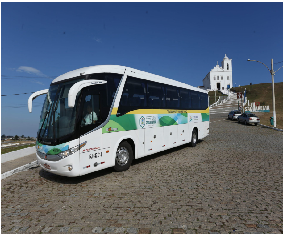
Há vagas para alunos que estudam nas universidades de Niterói e Cabo Frio

A Prefeitura de Saquarema, por meio da Secretaria Municipal de Educação, Cultura, Inclusão, Ciência e Tecnologia, vai iniciar o processo de inscrição para as novas vagas do Transporte Universitário. Há vagas para os estudantes que estudam em universidades das cidades de Niterói e Cabo Frio e as inscrições ocorrerão nos dias 17, 18 e 19 de fevereiro de 2025, das 9h às 16h. O resultado será divulgado no dia 21/02/2025, no site da Prefeitura.