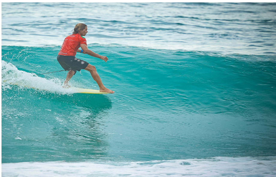
Evento acontece até o dia 23 de março e conta com duas arenas para as competições

O Aloha Spirit, um dos maiores festivais de esportes aquáticos do mundo, está acontecendo em Saquarema e seguirá até o dia 23 de março. Pela primeira vez em 17 anos, o evento abriu sua temporada fora de Ilhabela, no litoral paulista, escolhendo a Região dos Lagos como novo palco para as competições. A cidade recebe grandes nomes de modalidades como surf, paddle, canoa, entre outras.