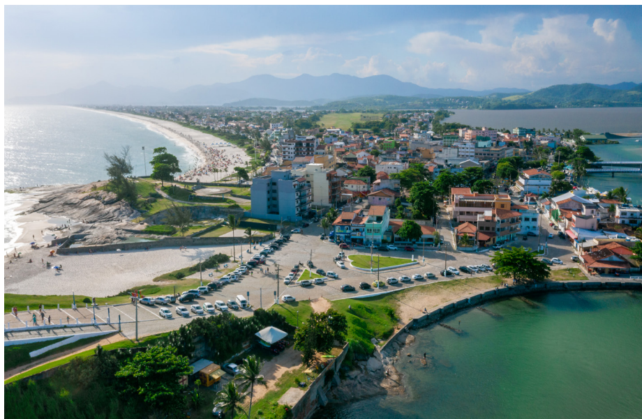
Número de pessoas com carteira assinada em 2025 supera os totais anuais desde 2020

De acordo com os dados do CAGED, o setor que mais gerou empregos foi