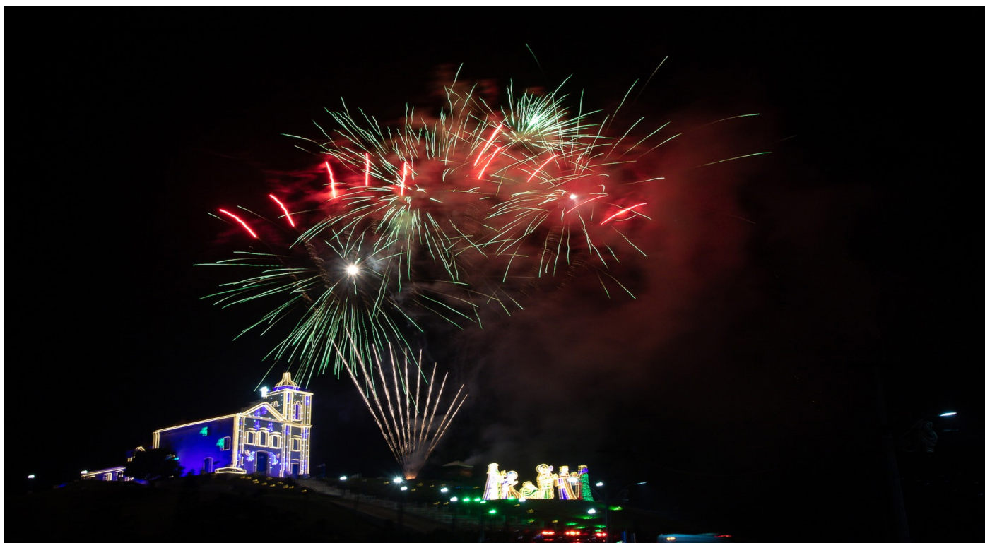
Um show de cores e formas iluminará o céu nas proximidades da Igreja de Nossa Senhora de Nazareth

A Prefeitura de Saquarema, por meio da Secretaria Municipal de Esporte, Lazer e Turismo, preparou uma linda festa para celebrar a chegada de 2026. Com eventos em diversos bairros, a programação terá início no dia 29 de dezembro.