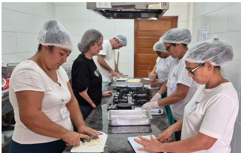
Agricultores poderão beneficiar a mandioca e agregar valor aos produtos derivados

Durante as aulas, os participantes aprenderam técnicas adequadas de processamento da mandioca para a fabricação de diversos produtos, como farinha, polvilho doce, tapioca, massa para salgados, nhoque, aipim palito, chips e palha, sempre com foco em boas práticas de higiene, qualidade e segurança alimentar. Ao final da capacitação, todos os alunos receberam certificado de conclusão emitido pelo SENAR.