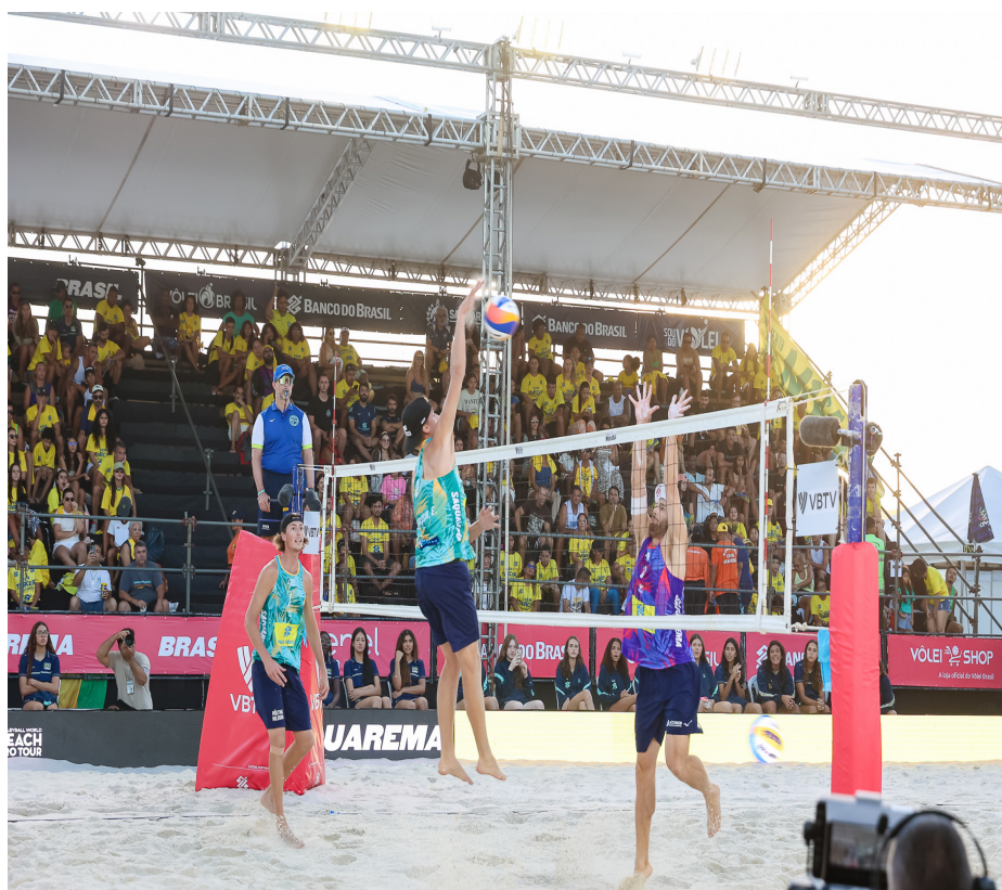
O evento reuniu esportistas de alto nível, atraindo milhares de visitantes

A iniciativa Viva + Esporte é um dos pilares que sustenta essa transformação. O projeto facilita o acesso da população a práticas esportivas e já tem mais de 3 mil moradores beneficiados, oferecendo