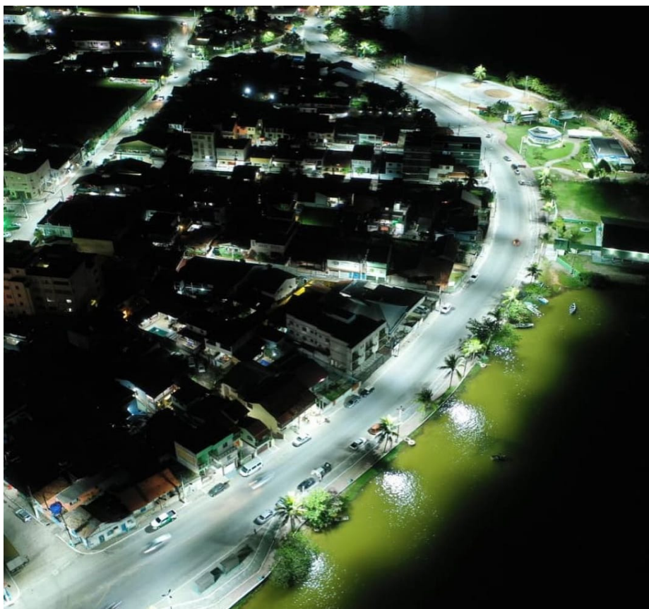
Saquarema conta, atualmente, com 27 mil pontos de iluminação pública em Led

A população de Saquarema poderá contar, já nos próximos dias, com um sistema que permitirá acionar a empresa responsável pela iluminação pública na cidade, sempre que houver um ponto de luz inoperante.