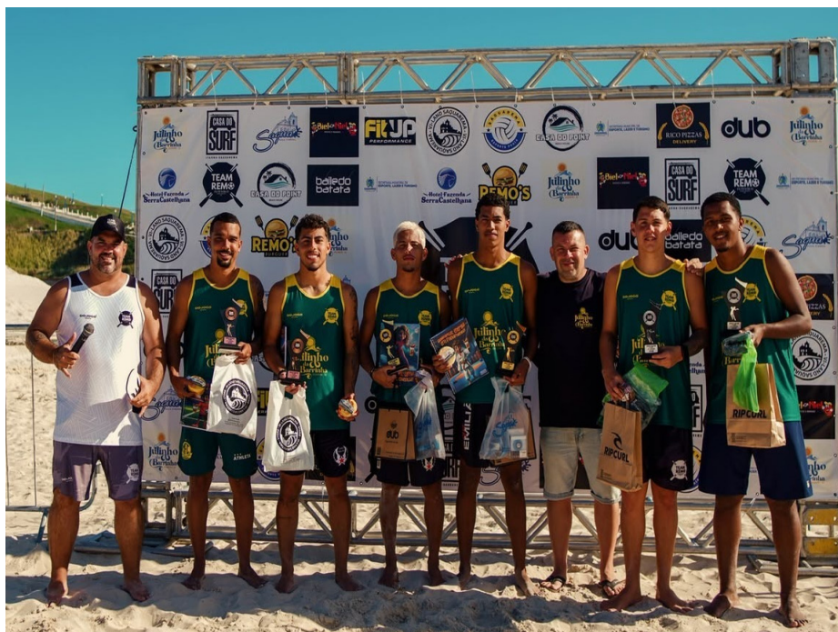
O circuito de futevôlei impulsiona a ocupação de pousadas e gastronomia local em junho.

A cidade, que tem um calendário anual estruturado para combater a sazonalidade do turismo litorâneo, passou a apostar também na orla como um promotor de eventos turísticos. Como exemplo, está o Circuito de Futevôlei Team Remo, criado em 2017 e que conta com três etapas anuais. Além da etapa em junho, ocorrida no último final de semana, Saquarema também é casa de uma das fases do Campeonato Brasileiro Profissional de Futevôlei (Open Nacional), ampliando a oferta turística para torneios de vôlei de praia, beach tennis, skimboard e demais modalidades de praia que atraem atletas e torcedores de diversos municípios do estado do Rio de Janeiro.